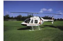
Helikopter Preis auf Anfrage