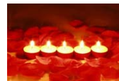
romantische Suite Dekoration mit Rosenblütenblätter, Teelichter, Herzklopfenmusik € 33,00