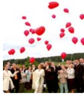
Luftballonstart € 2,00 pro Luftballon