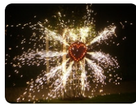
Brennendes Herz € 190,00