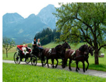
Pferdekutschenfahrt zirka € 200,00