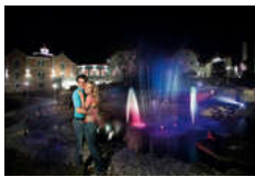
Licht-Wasser-Musikspiel Mai – Oktober kostenlos