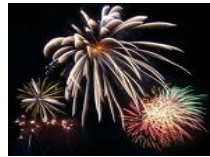
Feuerwerk 4 Minuten - € 350,00 6 Minuten - € 480,00