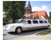
Limousine Preis auf Anfrage