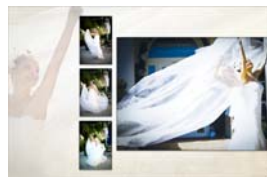
Hochzeitsfotoshooting Preis auf Anfrage