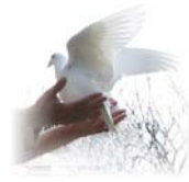
Start von 2 weißen Tauben € 50,00